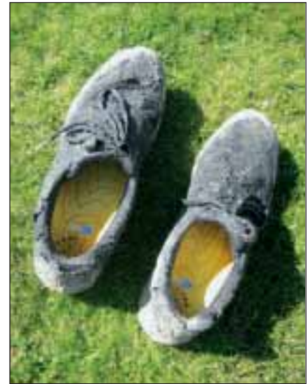
2 Auch wenn man nach dem Lauf vom eigentlichen Schuh außen nicht mehr viel sieht: Eine schmale und gut geformte Ferse stellt einen essentiellen Baustein der Sporteinlage dar.

Zur optimalen Passform der Einlage im Schuh sollte die Umrismaße sowie die Dicke (in der Regel 4 mm) der bestehenden Innensohle berücksichtigt werden. Zum Erreichen der optimalen